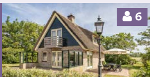
Villa met serre 210, 212, 214