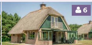
Villa 51, 57, 61