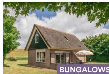
DE WITTE HOEK