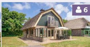
Villa 136, 140