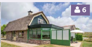
Villa met serre 124, 126, 128