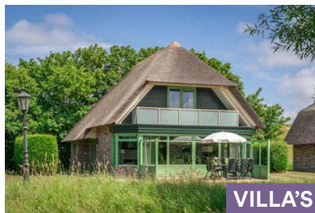
DE WITTE HOEK