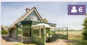
Villa 194, 196, 200, 202, 204, 206, 208