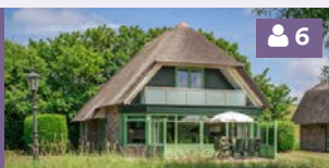
Villa met serre 138