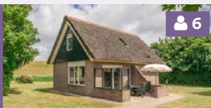
Bungalow 132, 134