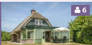
Villa serre 53, 55, 59, 63, 65, 67, 69, 71